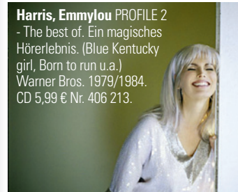
Harris, Emmylou PROFILE 2 - The best of. Ein magisches Hörerlebnis. (Blue Kentucky girl, Born to run u.a.) Warner Bros. 1979/1984. CD 5,99 € Nr. 406 213.

Newman, Randy LONELY AT THE TOP „Diese 16 Songs beweisen dem Zuhörer Randy Newmans Talent als Songwriter“ (AllMusicGuide). (Love story, Living without you u.a.) Warner. 1987. CD 6,99 € Nr. 406 053.