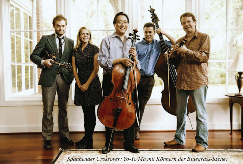
Spannender Crossover: Yo-Yo Ma mit Könnern der Bluegrass-Szene.